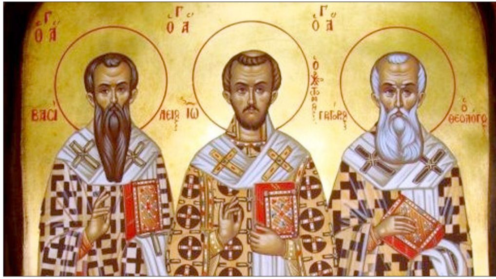
μελλοντικές γενεές». Έτσι ο Ιωάννης εποίησε όπως του διατάχθη και επέβαλε ειρήνη ανάμεσα στους φιλονικούντας.